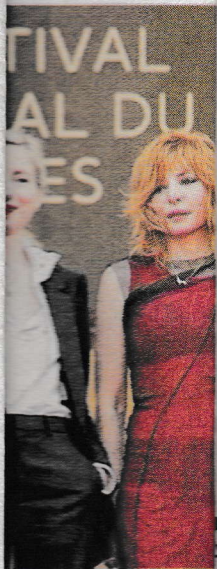
...nt, la réalisatrice franco-sénégalaise et la ministre de la Culture